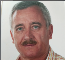
JOSÉ ANTONIO ORTEGA LARA