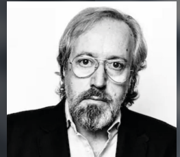
JUAN CARLOS GIRAUTA